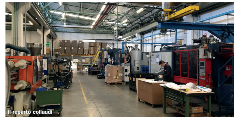
Il reparto collaudi